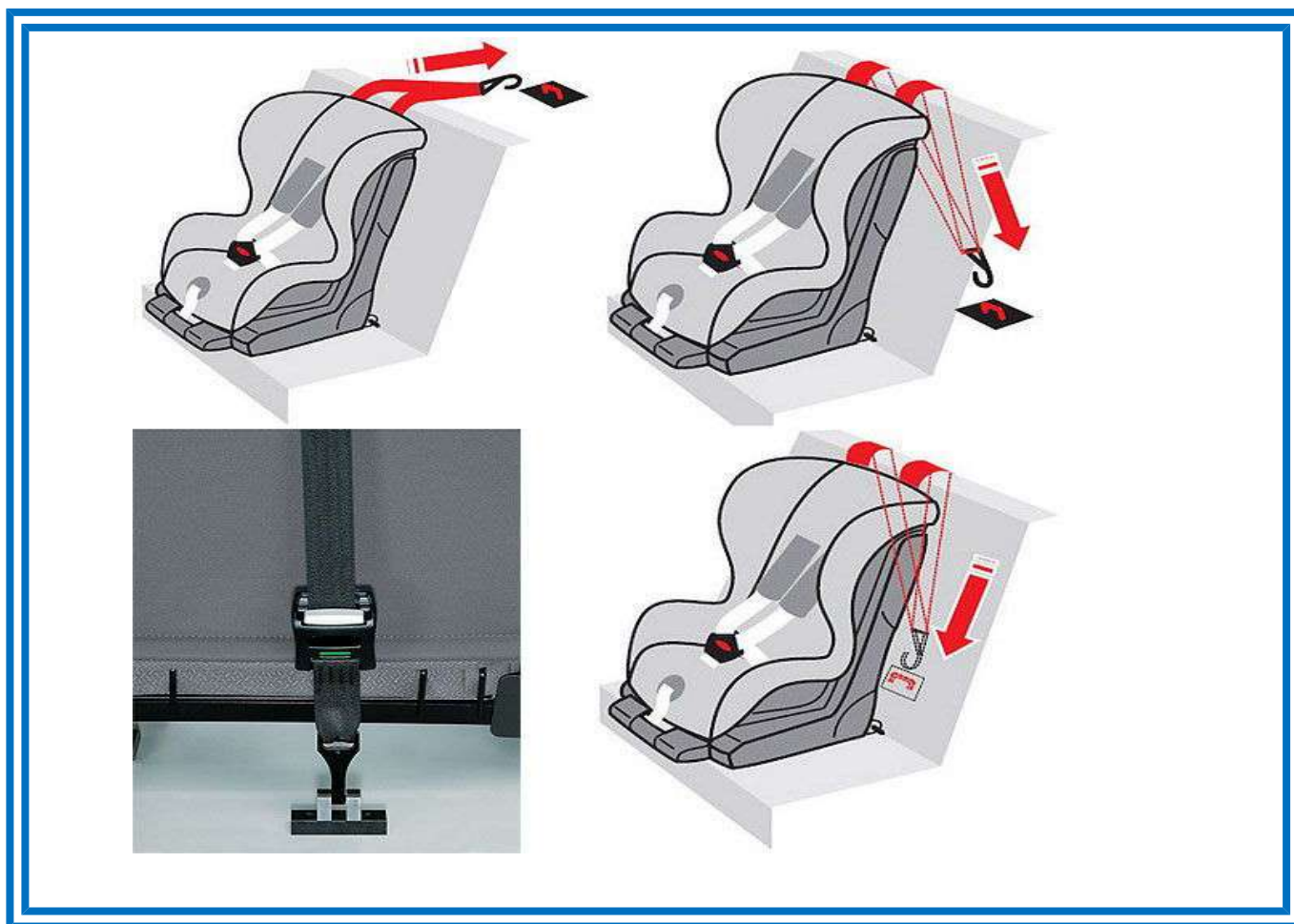
Рисунок 7. Способы фиксации якорного крепления

После того, как автокресло установлено, необходимо учесть ряд условий при усаживании в него ребенка.