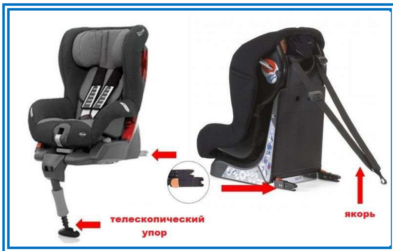
Рисунок 6. Телескопический упор и якорное крепление

Телескопический упор, который еще называют «упорная нога», чаще всего используется в автокреслах с системой Isofix для упора в пол автомобиля, что обеспечивает более жесткую фиксацию детского автокресла.