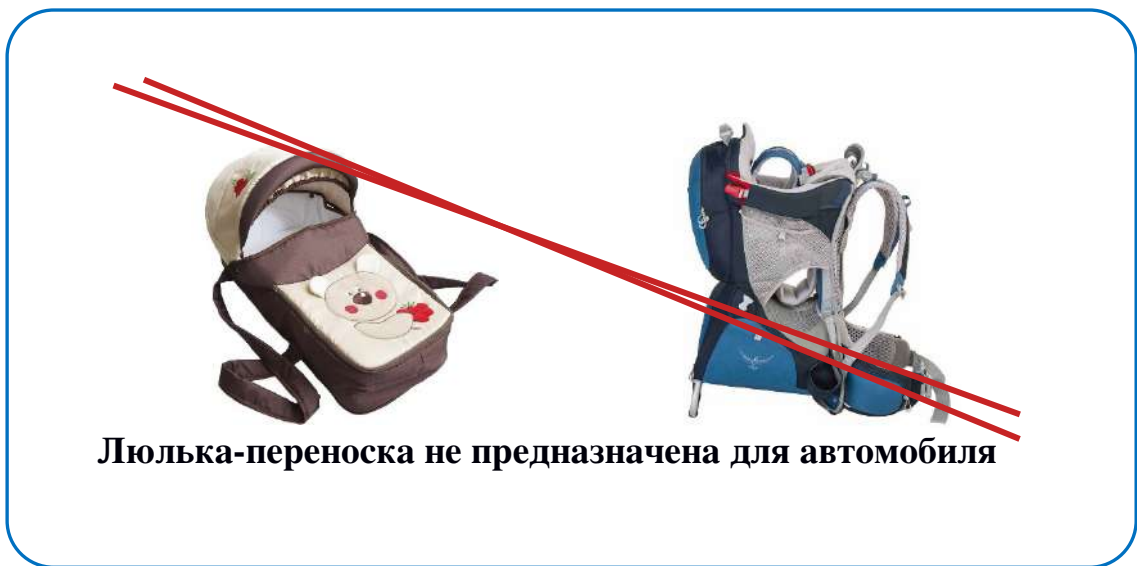
Рисунок 3. Внешний вид люльки-переноски

Конечно же, в специальной автолюльке или автокресле категории «0+». Выбирать специальное кресло для новорождённых нужно с особой тщательностью. Хотя оно прослужит недолго, родителям необходимо изучить сертификаты и отзывы о каждой конкретной модели, оценить анатомическую форму, качество встроенных ремней и надёжность фиксаторов. Рекомендуется обратить внимание на материалы внутренней отделки самой автолюльки, они должны быть гипоаллергенными и нескользящим. Следует продумать одежду малыша, так как в автолюльке он закрепляется трехточечным ремнем, проходящим через плечи и между ног. Детские игрушки, взятые в дорогу, должны быть мягкими.