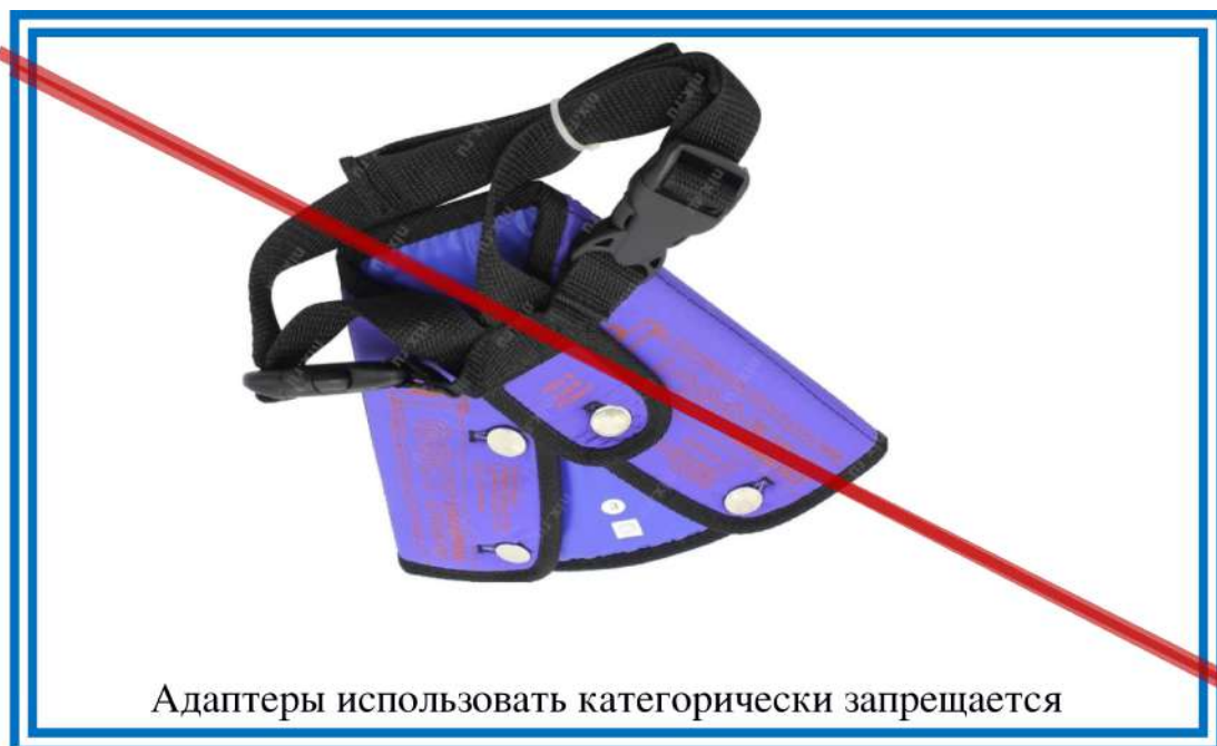
Рисунок 2. Внешний вид адаптера

Кроме представленных детских удерживающих устройств в магазинах еще продаются адаптеры как фирмы «ФЭСТ», так и других фирм. Госавтоинспекция выступает категорически против их применения, так как при ДТП адаптер оказывает слишком высокие нагрузки на брюшную полость ребенка, практически врезается в нее, что приводит к травмированию внутренних органов.