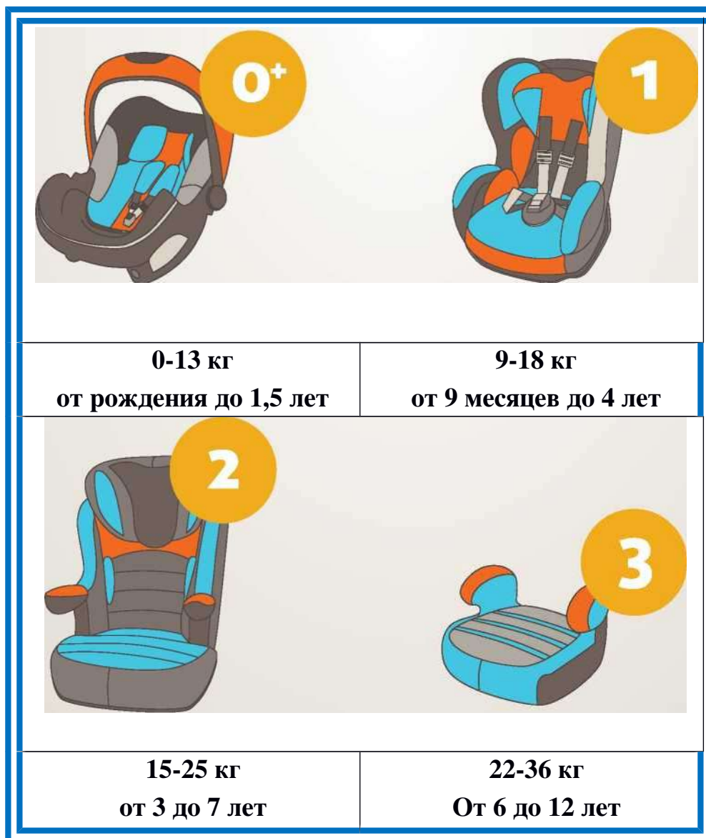
Рисунок 1. Виды детских удерживающих устройств.

Позиция Госавтоинспекции заключается в том, что ребенка в возрасте от 8 до 12 лет как можно дольше надо перевозить в автомобиле именно с использованием детского удерживающего устройства, обеспечивая тем самым наиболее безопасные условия перевозки.