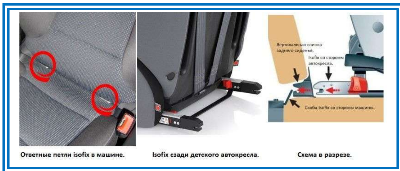
Рисунок 5. Крепления ISOFIX

Крепления ISOFIX как самостоятельные используются для автокресел групп 0+/1 (до 18 кг), в которых ребенок фиксируется ремнями безопасности автокресла, которое в свою очередь к автомобилю крепиться непосредственно системой ISOFIX.